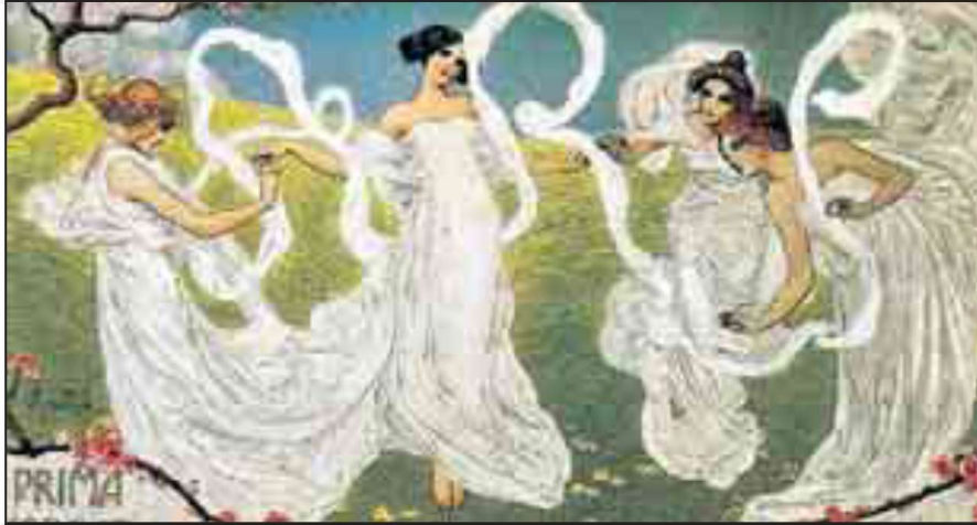
Accanto il manifesto Art Noveau di Bistolfi Sotto una statua Art Noveau e un orologio della stessa epoca